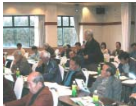
・会場との意見交換

まず、阿蘇の草原再生については畜産が基本であることを踏まえ、牧野組合が行う維持管理活動への支援について、ボランティアの導入や都市との交流などに関して意見交換が行われた。主な意見内容を以下にまとめた。