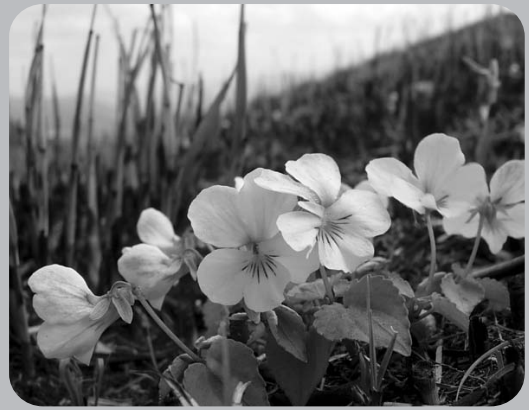
のや ご そうげん 野焼き後の草原にさくキスミレ

はる のや 春になると、野焼きでまっくろ こげになった草原に、みどりの で めが出て、いろとりどりの花が はな さくよ。