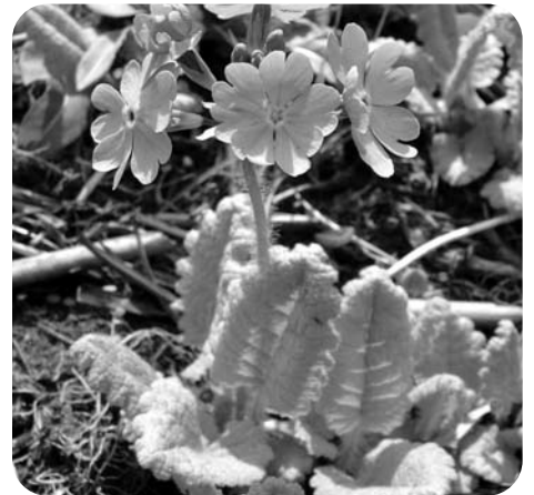
いろ はな ピンク色の花がさくサクラソウ

はる はや とき のや 春の早い時に野焼きをして ふる くさ あたら 古い草をやくことで、新しくて げんき くさ 元気な草がはえてくるんじゃ。 草原は、きせつによって いろいろなかお み いろいろな顔を見せてくれる んじゃよ。