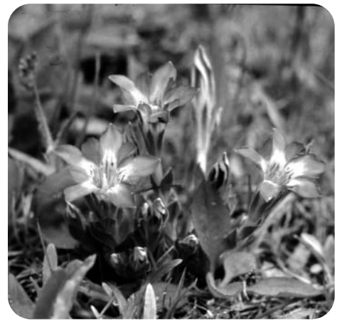
いろ はな むらさき色の花がさくハルリンドウ