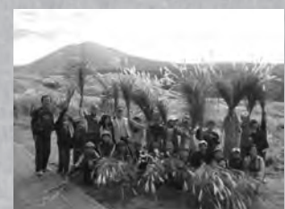
モデル校の取り組みは、新しい環境学習のかたちを模索する活動として注目されています。