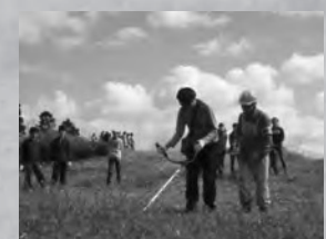
阿蘇火山博物館や阿蘇グリーンストックでは、約9,000名/年もの修学旅行生を受け入れています。

・「モデル校における年間プログラムの実践」では、「阿蘇草原キッズ・プロジェクト」の一環として、2つのモデル校を設け、総合的な年間カリキュラムを試行しています。