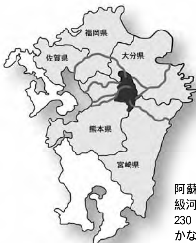
九州の中の阿蘇地域

阿蘇の草原は 6 本の一級河川の源流域にあたり、230 万人の飲み水がまかなわれている。