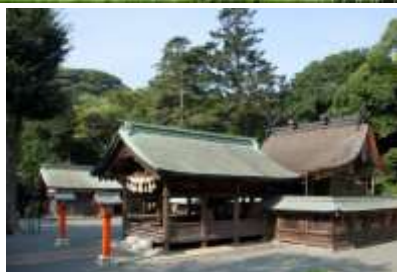
宗像大社中津宮 (大島)