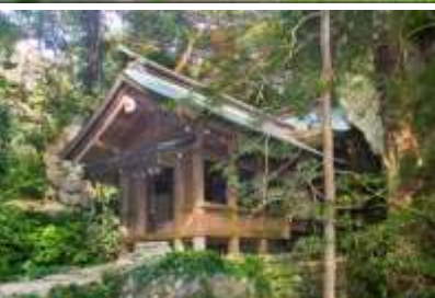
宗像大社沖津宮 (沖ノ島)