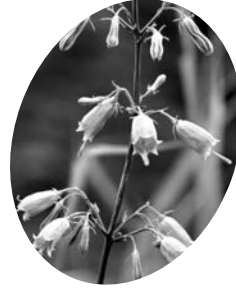
サイヨウシャジン