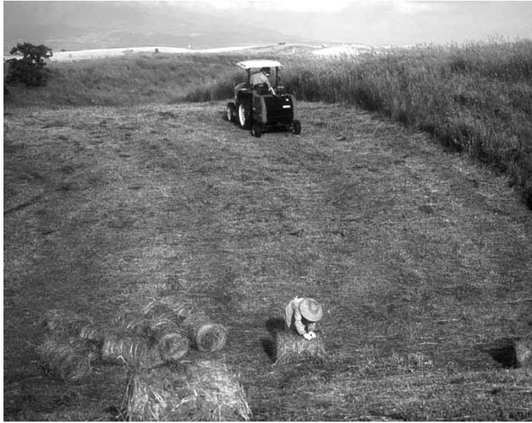
ほ くさか 干し草刈りの様子

「草原しんぶん」は、阿蘇の草原のことをみなさんに知ってもらうために発行しました。阿蘇の草原ではどんなことが行われているのか、どんな問題が起きているのか、考えてみましょう。そして、学校やお家の方と話し合ってみましょう。