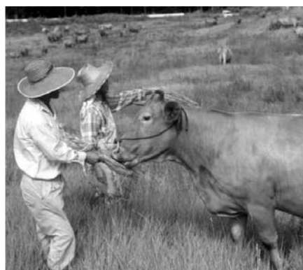
あか牛 うし の世話を せわ する農家 のうか の人 ひと

そうげん うし 草原でくらす おかあさん牛 うし が 生 う んだ子牛 こうし が育 そだ って、 ぼくら た が食 にく べる肉になるんだね。