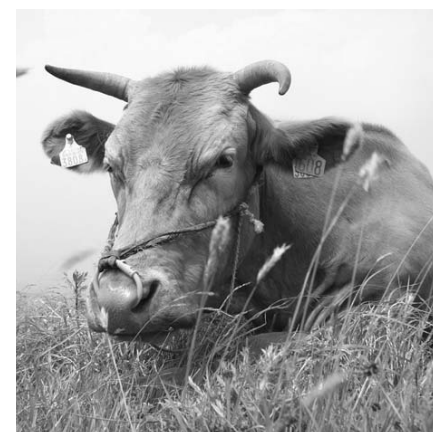
草 くさ を食 た べてひとやすみ