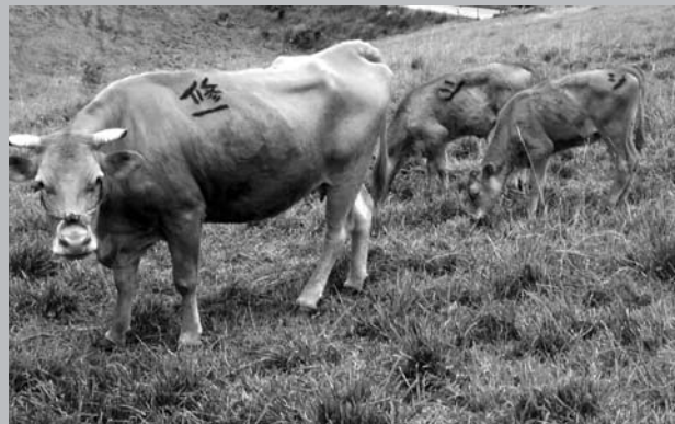
あか牛 うし のおやこ

そうげん くさ た うし 草原で草を食べている牛の おやこ。私 わたし たちのくらしと どうかかわっているのかな？