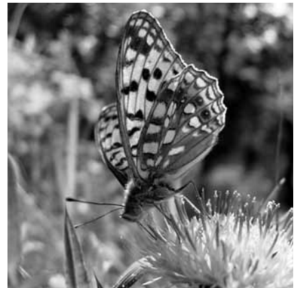
ウラギンヒョウモン