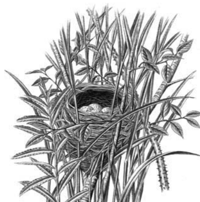
絵『木村 修』出版社名『世界文化社』 書名『日本の野鳥 巣と卵図鑑』より転載