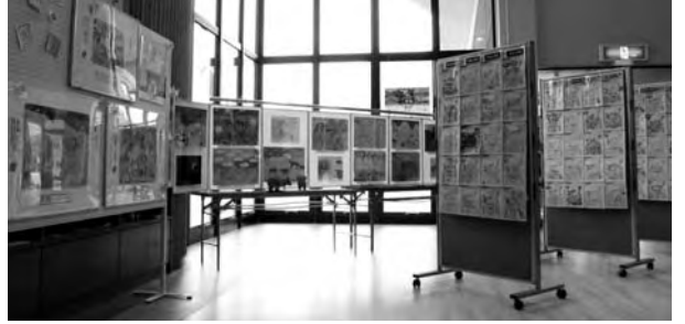
第1回「阿蘇の草原を描こう！コンテスト」の展示の様子

草原クイズの答えは、アはキツネ、イはアカ牛、ウはノウサギです。足跡の大きさと形から判断できます。