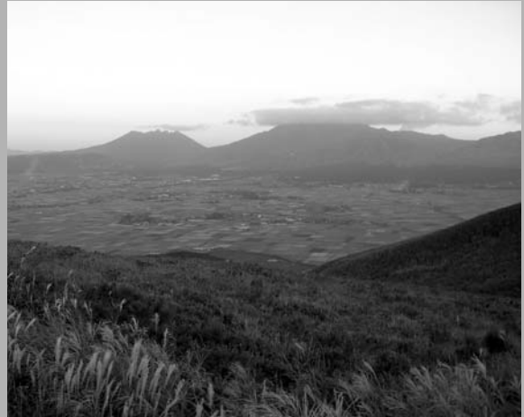
けしき カルデラの景色

みんなが す 住んでいる あそ 阿蘇は かわった ちけい 地形をしています。 この ちけい 地形は「カルデラ」といって かざん 火山の か ふん火で できました。