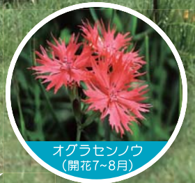
オグラセンノウ (開花7~8月)

牛の世話や野菜づくりには、草原の草が必要じゃ。そこで毎年、野焼きや草刈りをしているんじゃよ。こうすることで、草原も守られるんじゃ。