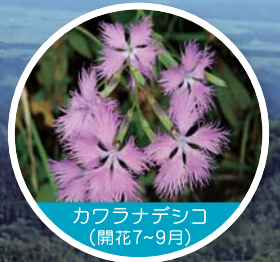
カフランダシコ (開花7~9月)