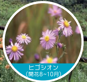
ヒゴシオン (開花8~10月)