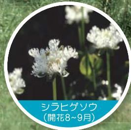
シラヒゲソウ (開花8~9月)