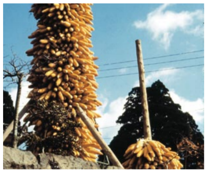
とうもろこし掛け

秋に収穫されたとうもろこしは、冬場の牛馬のエサとして、軒先などにつるして保存される。