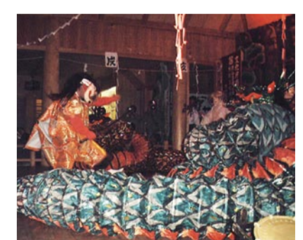
長野岩戸神楽(南阿蘇村)

長野阿蘇神社で、春と秋に行われる。豊作を願って歌や踊りを神様にささげる行事。国選択の無形文化財。